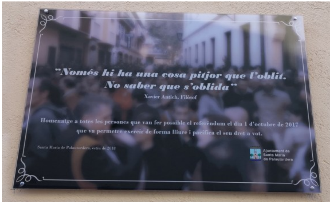
Aquesta és la placa que algú ha robat a Santa Maria de Palautordera