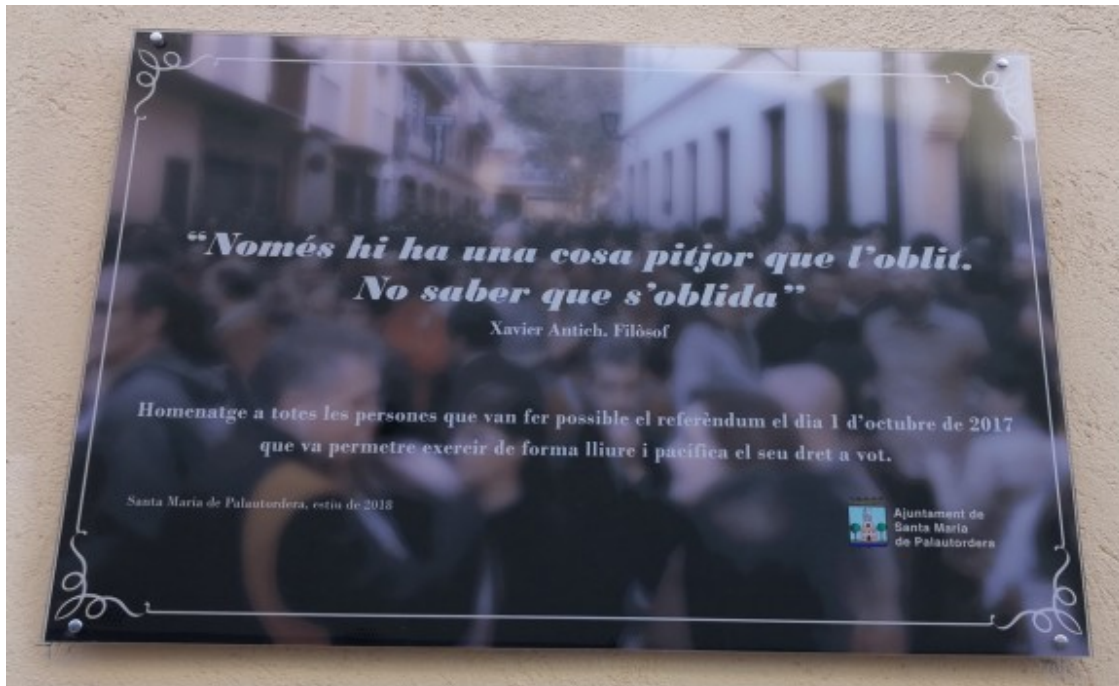
Una placa al Passatge U d'Octubre de Santa Maria de Palautordera en homenatge a tots els votants del referèndum

A Santa Maria de Palautordera aquest dijous s'ha col·locat el nom del carrer del Passatge de L'U d'Octubre, a tocar del Centre Cívic, un dels col·legis electorals del dia que es va votar el referèndum. En aquest municipi la comissió organitzadora de l'1O ha programat varietat d'actes com la pintada del mural els dies 29 i 30 de setembre al Passatge de l'U d'Octubre. Per diumenge a la tarda els palauencs volen desplaçar-se a Vilalba Sasserra en un acte de "desgreuge per la violència policial" en marxa lenta de vehicles. I el dilluns 1 d'octubre s'inaugurarà oficialment la placa del Passatge i el mural, per acabar amb un sopar de germanor - carmanyola- a la plaça de la Vila. Des de Santa Maria de Palautordera també donen suport a l'anti-manifestació a favor de la Guàrdia Civil.