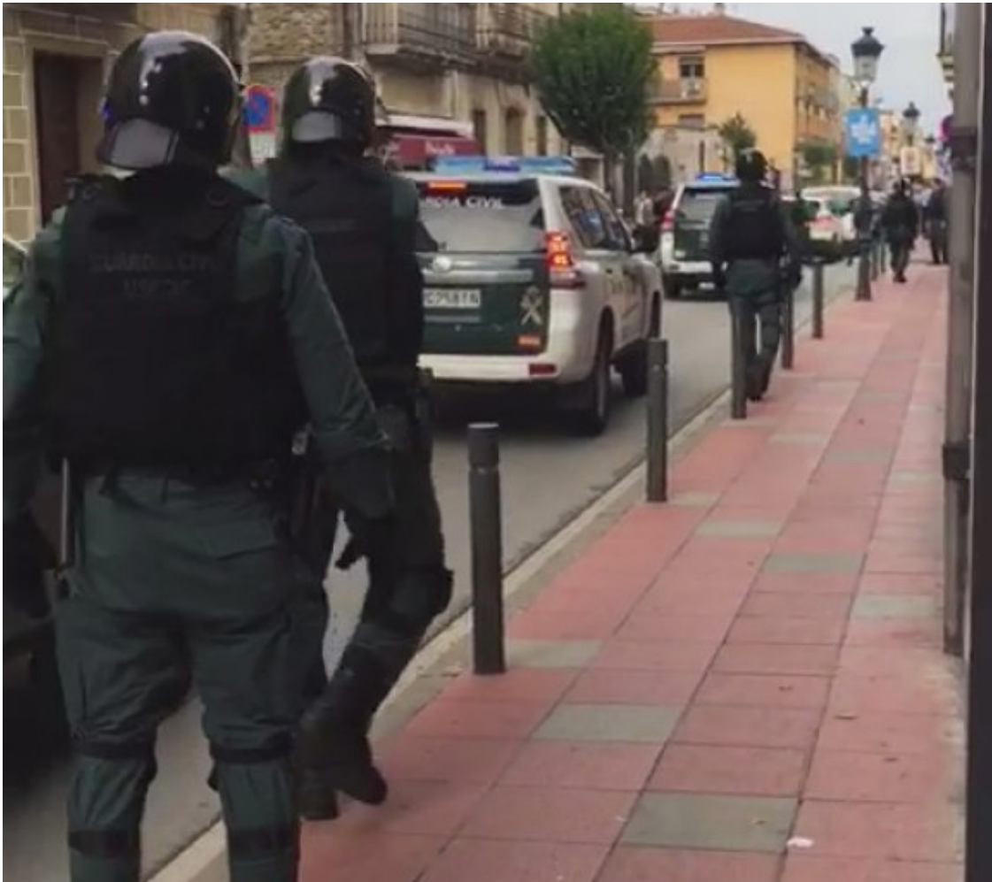
La Guàrdia Civil va passejar-se per la Carretera Vella de Sant Celoni amb l'ànim de violentar la ciutadania