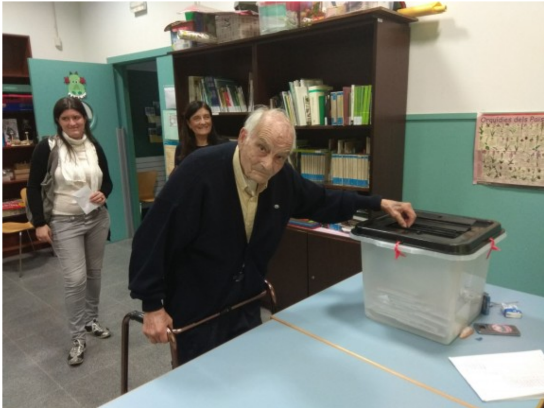
Sant Celoni va votar sí a la independència l'1 d'octubre de 2017

Aquest és el cas de Vilalba Sasserra , un dels pobles més petits de la comarca i l'únic on la violència policial contra veïns i veïnes defensaven pacíficament el seu col·legi electoral al Centre Cívic exercint el seu dret a poder votar democràticament i decidir el futur del seu país. Amb dignitat van suportar les càrregues policials i per això, ells més que ningú del Baix Montseny aquest diumenge 30 de setembre celebraran a la pista esportiva 1 d'Octubre un acte contra la violència policial que organitza l'Ajuntament, el CDR i l'Assemblea de Vilalba Sasserra.