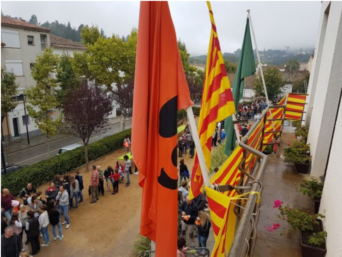
Plaça de la Vila de Vallgorguina l'1 d'octubre de 2017

A Vallgorguina també hi ha cartell per recordar l'1 d'Octubre de l'any passat. En aquest sentit, el mateix dilluns a les set de la tarda s'inaugurarà una exposició de fotografies de Romà Salvador "La defensa de les urnes" i una hora més tard s'inaugurarà el Passatge 1 d'Octubre i es farà la projecció d'un recull de fotografies fetes pels veïns i veïnes del municipi. També es facilitarà un espai perquè tothom qui ho desitgi pugui relatar la seva experiència i s'acabarà amb un sopar de carmanyola.