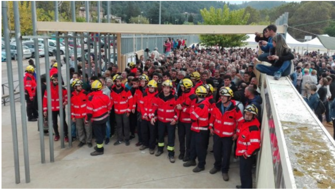
El Bombers d'Arbúcies a primera línia en la defensa de les urnes i els col·legis electorals l'1 d'octubre de 2017

A Arbúcies les entitats d'Arbúcies estan fent una crida a tota la ciutadania perquè participi aquest dissabte 29 de setembre al rodatge del lipdub a partir de les 4 de la tarda als carrers Castell, Vern i plaça de la Vila. El mateix dissabte 29, la XEDA amb la col·laboració de l'Associació de Dones hi haurà un sopar per la República. Un àpat que comptarà amb parlaments, música i altres sorpreses que s'aniran desvelant al llarg del vespre. El sopar per la República serà a les 9 del vespre al pati de l'Escola Dr. Carulla.