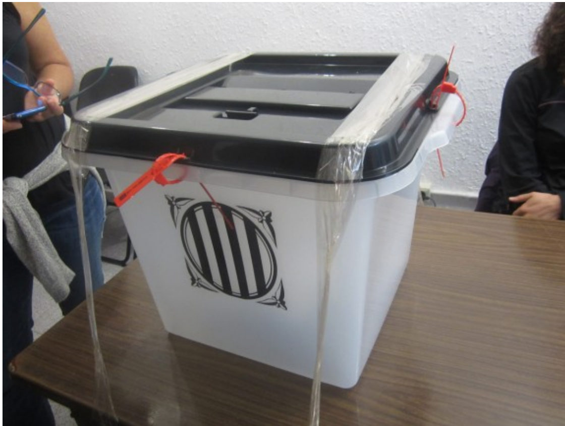
Al Baix Montseny hi va haver urnes i es va votar l'1 d'octubre de 2017

A Sant Pere de Vilamajor davant la Fàbrica a dos quarts de vuit del vespre es farà un acte d'homenatge a la democràcia el dia 1 d'octubre "Vam votar".