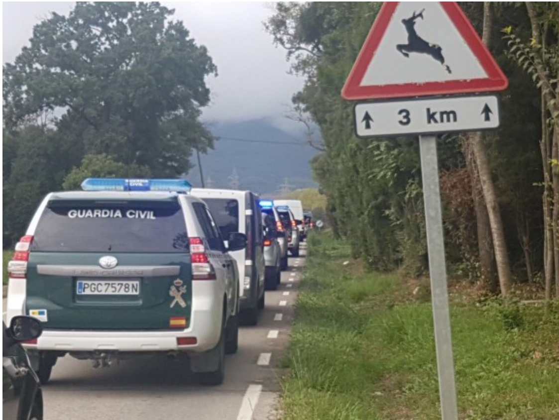
El GPS a favor de la democràcia. La Guàrdia Civil perduda per Fogars de Montclús