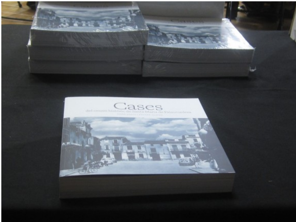
Recull històric de Santa Maria de Palautordera