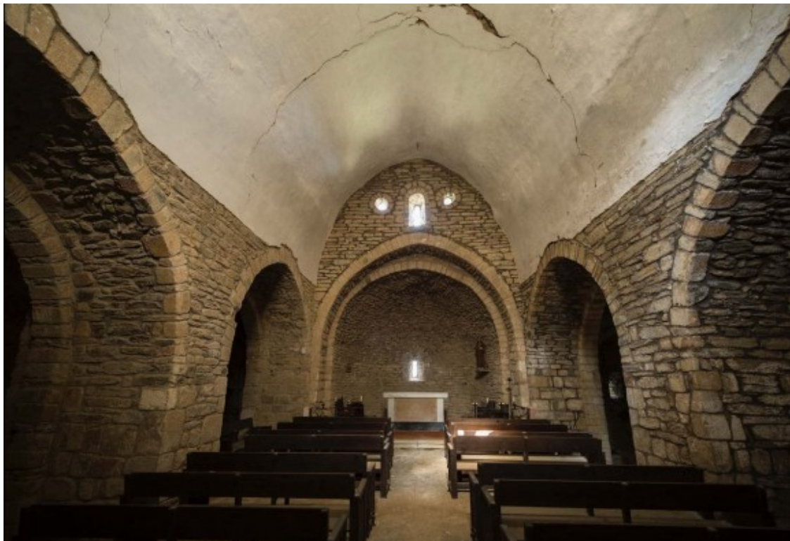
Església romànica de Santa Magdalena de Mosqueroles

El fotògraf de Santa Maria de Palautordera, Mariano Pagès, ha editat el llibre El romànic del Montseny a través de verkami. Aquesta obra reuneix per primera vegada la totalitat de les edificacions religioses erigides entre els segles X i XII al territori montsenyec. Una rigorosa tasca fotogràfica, però, que també inclou una ressenya històrica de cada temple. El romànic del Montseny és representat a través d'imatges dels interiors dels temples i les seves façanes, els seus elements decoratius, expressions artístiques i tipologies constructives pròpies de l'estil. Arquitectura, talles de pedra, policromies, peces conservades in situ , en col·leccions privades o en museus, més de 60 temples reunits en un únic exemplar.