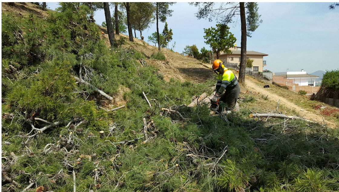
Creació d'una franja de protecció en una urbanització de Cervelló | Diputació de Barcelona

Les mesures d'autoprotecció poden evitar danys personals i materials en cas d'incendi | La Llei d'incendis forestals obliga a disposar de franges perimetrals netes de vegetació al voltant dels nuclis de població situats a prop del bosc