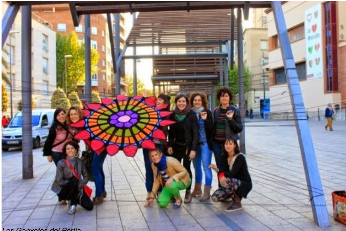
Les Ganxetes del Pòrtia.